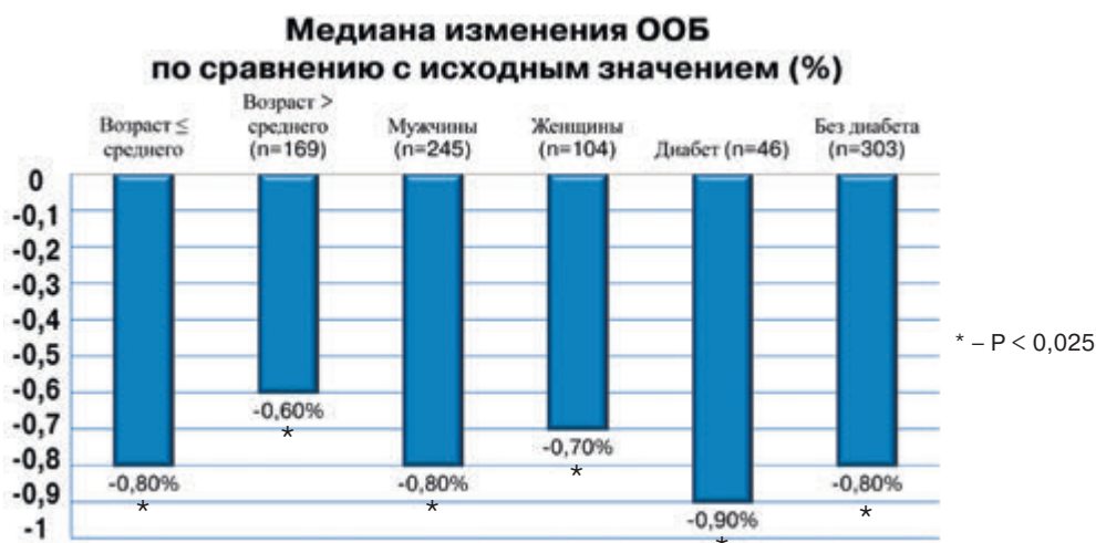
Рис. 1. Регресс атеросклеротических бляшек в результате лечения розувастатином в исследовании ASTEROID

жением изменений в размерах бляшки на каждом из 10 последовательных сечений.